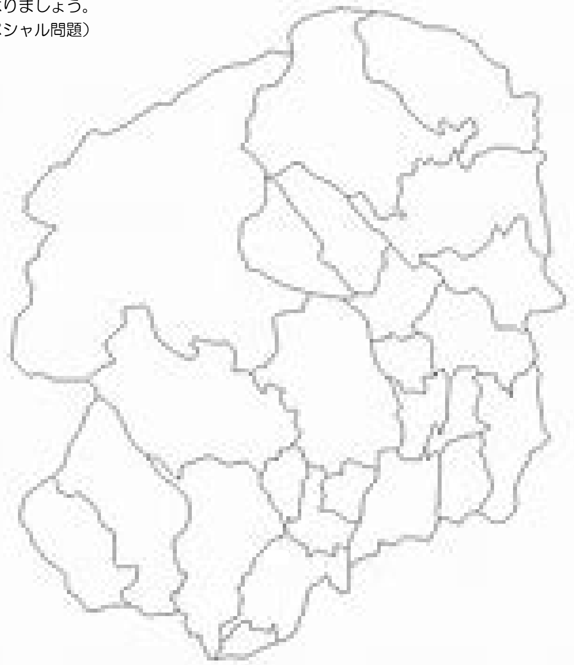
栃木県の市町のマーク